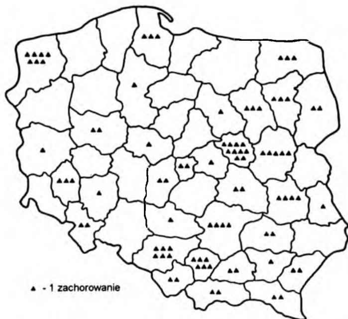
Ryc. 2. SSPE w Polsce – zachorowania w latach 1990–1993 (rozkład wg województw)